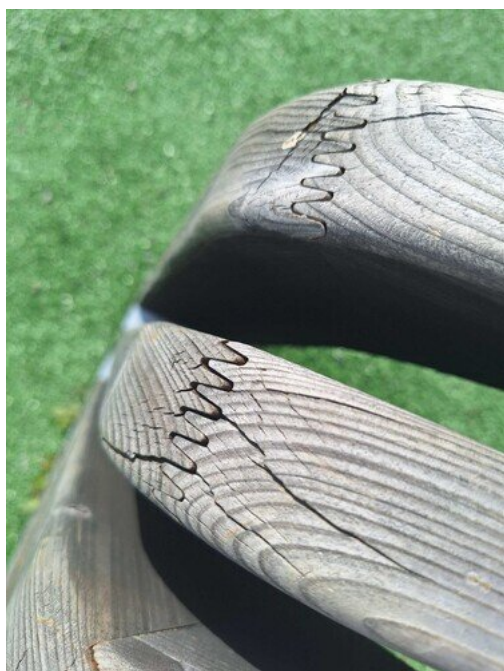
Kuva 6 Liitokset auki, tikkuja