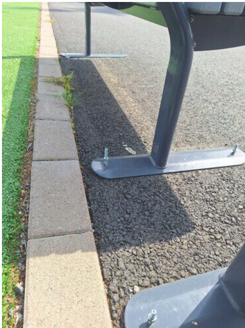
Kuva 20 Löysä, pultin kannat korkeat