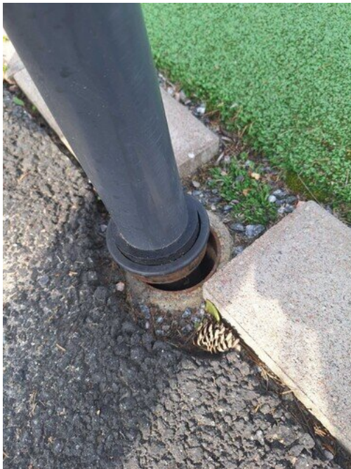
Kuva 22 Perustus irti