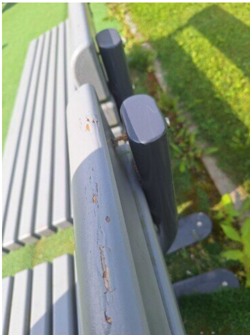
Kuva 16 Ruuvit irti