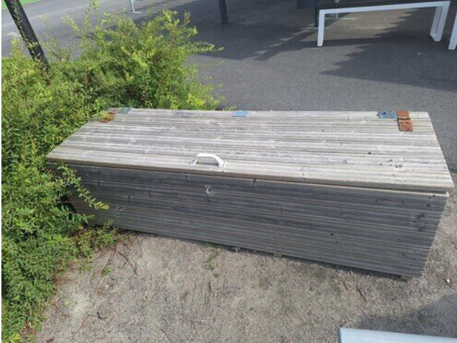
Kuva 34 Sormen litistymisvaara kannen ja reunan välissä