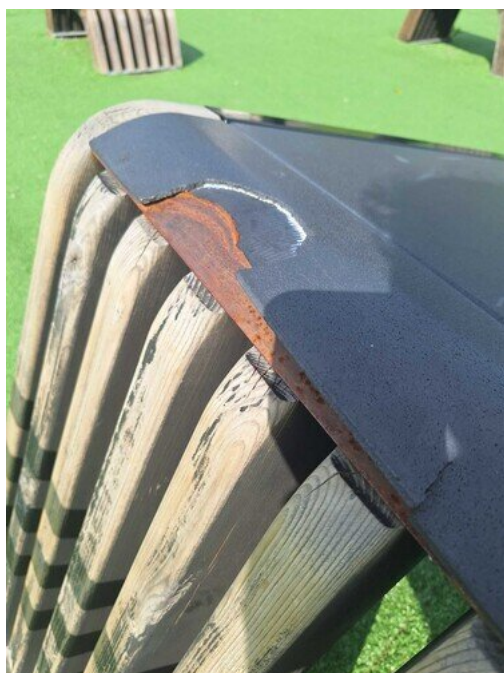
Kuva 4 Pehmuste rikkoutunut