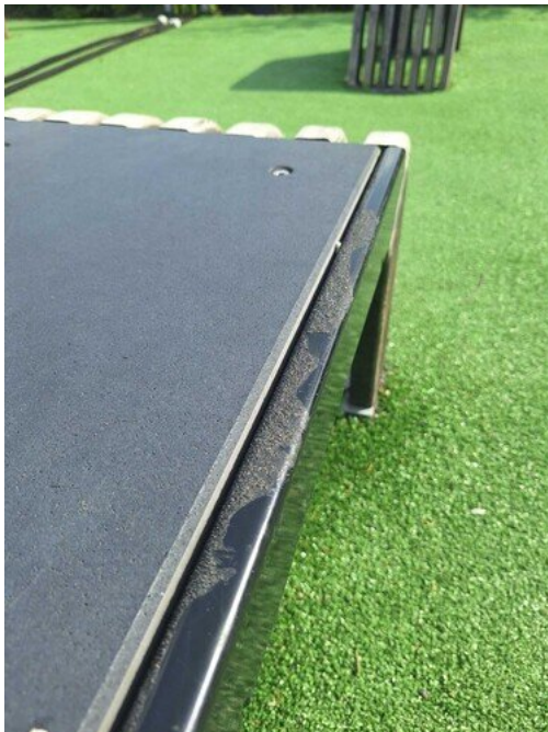
Kuva 10 Puutteellinen liukastumisen esto