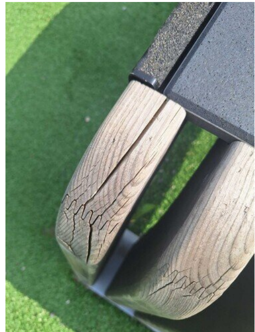
Kuva 11 Liitokset auki, halkeamia