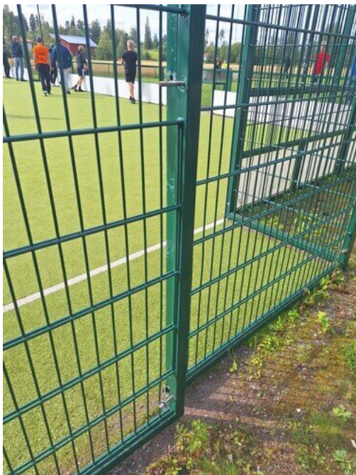
Kuva 41 Seinä irti, kiinnitykset auki