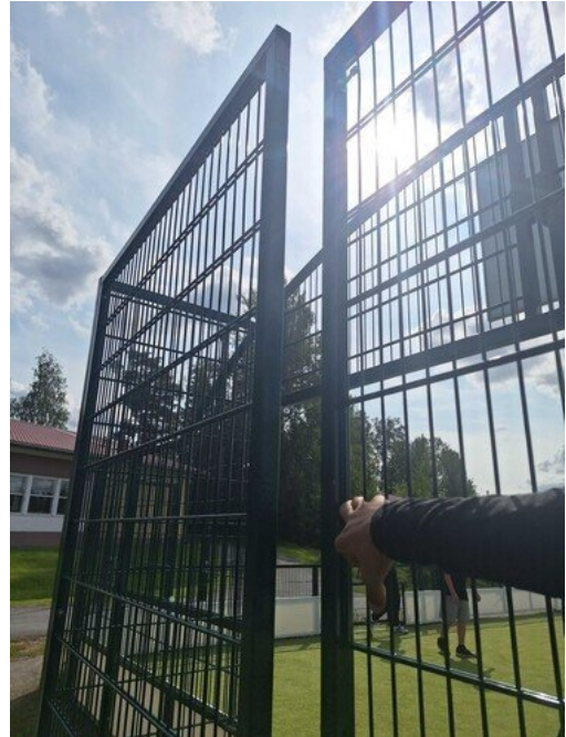
Kuva 40 Seinä irti, kiinnitykset auki