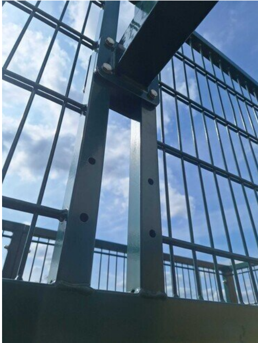
Kuva 39 Sormen kiinni juuttumisriski