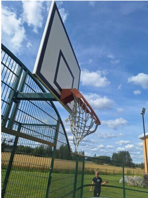
Kuva 38 Kori-palloteline vääntynyt