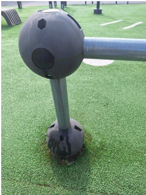
Kuva 29 Heiluu, ruuvit löysät