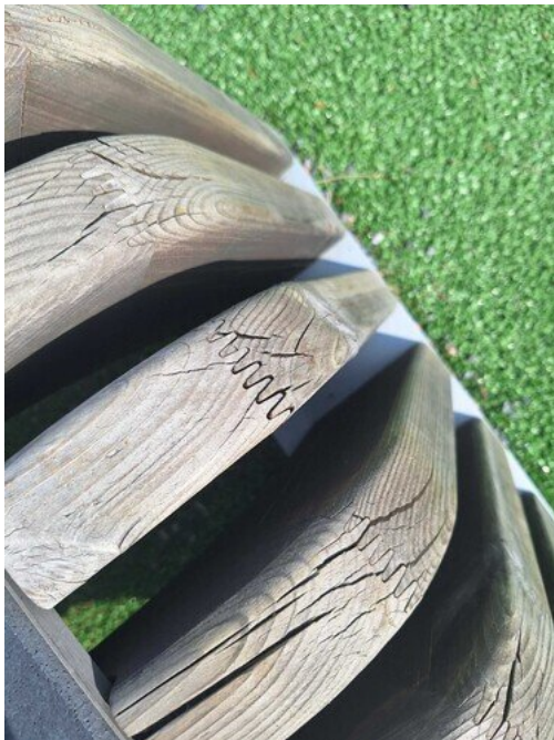
Kuva 14 Halkeamia, liitokset auki