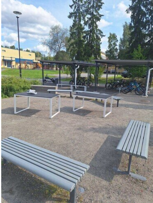
Kuva 32 Pöydät irtonaiset, leikkipaikalla tai sen välittömässä läheisyydessä sijaitsevien kalusteiden tulisi olla kiinnitettyjä, jotta niitä ei siirreltäisi esimerkiksi leikkivälineiden turva-alueille tai paikkoihin, joka mahdollistaisi ei-toivotun kiipeilyn