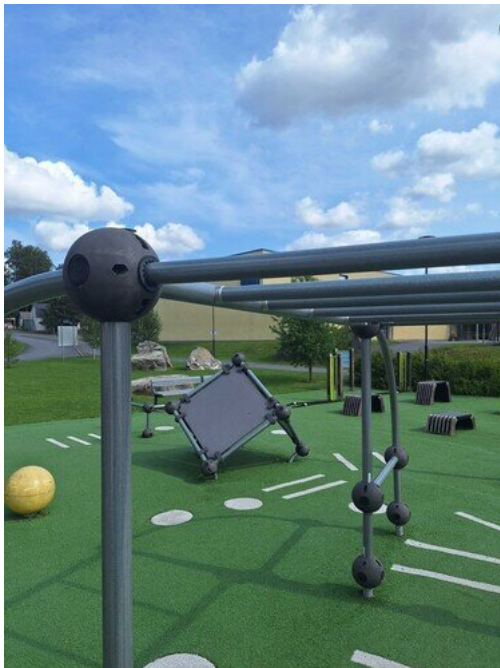
Kuva 24 Putket löysällä