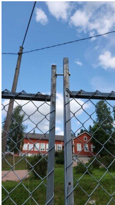
Kuva 40 Kiinnitys irronnut