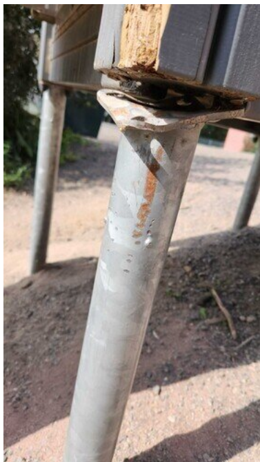
Kuva 7 Jalka irti