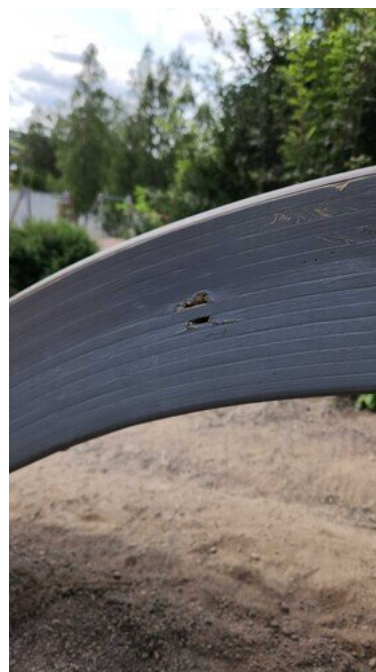
Kuva 5 Rikki