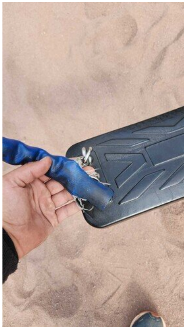
Kuva 31 Ketjunsuojat rikki