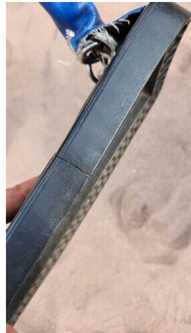
Kuva 32 Istuin rikki