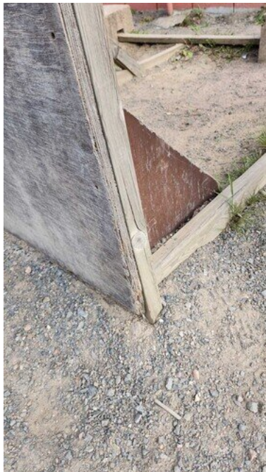
Kuva 12 Kulunut ja laho