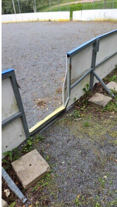
Kuva 42 Tolppa vääntynyt