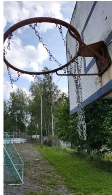
Kuva 50 Koriverkko rikki