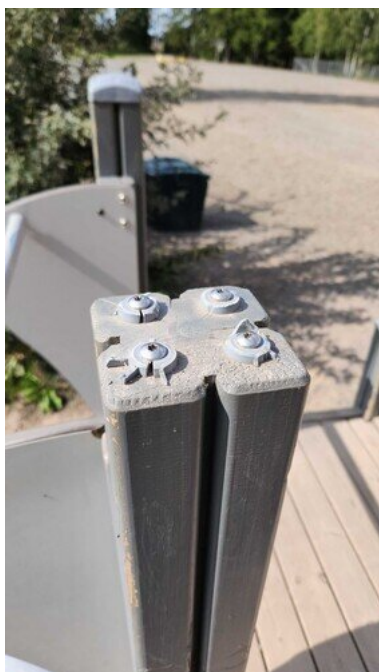
Kuva 4 Suoja rikki