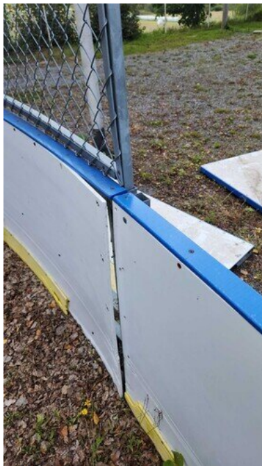
Kuva 44 Laita rikki, ruuvit puuttuu