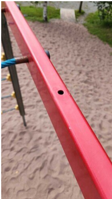
Kuva 24 Sormen kiinnijuuttumisvaara