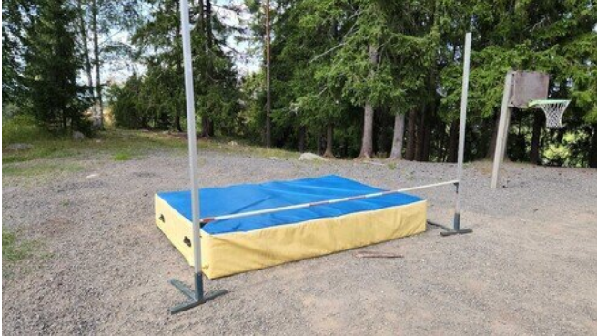
Kuva 19 Irtonainen, leikkipaikalla tai sen välittömässä läheisyydessä sijaitsevien kalusteiden tulisi olla kiinnitettyjä, jotta niitä ei siirreltäisi esimerkiksi leikkivälineiden turva-alueille tai paikkoihin, joka mahdollistaisi ei-toivotun kiipeilyn