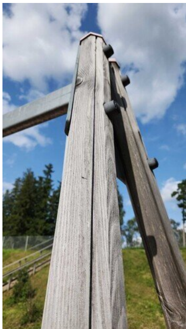
Kuva 29 Ruuvit löysällä