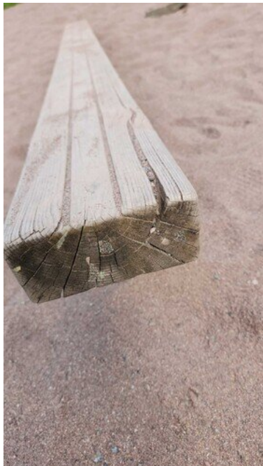
Kuva 38 Lahovaurioita