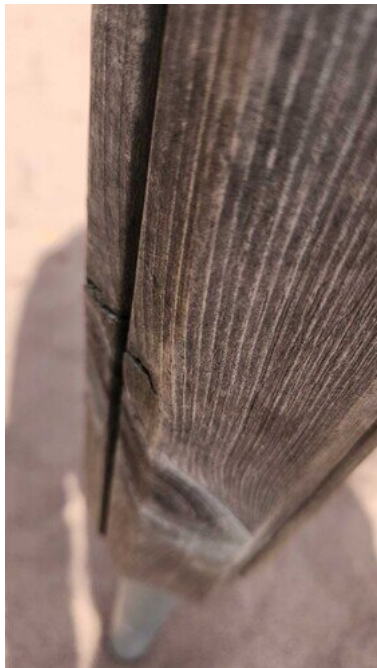
Kuva 22 Tikkuilee