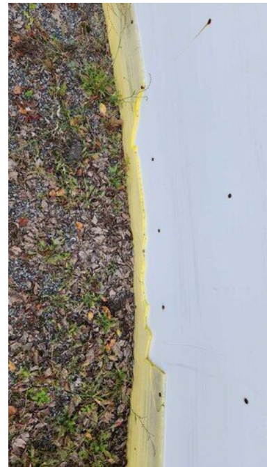
Kuva 41 Kaukalon alareuna rikki