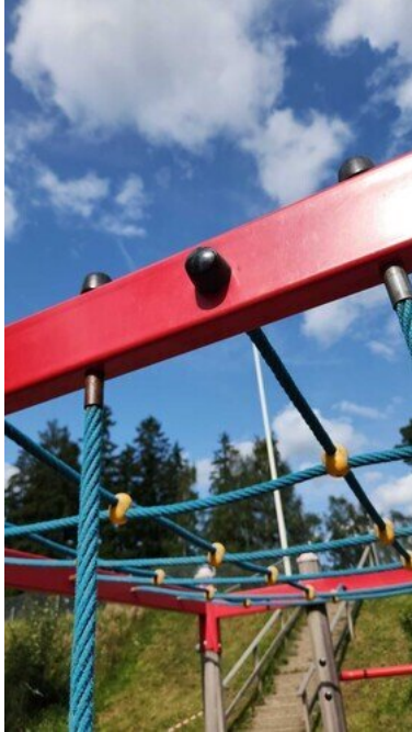
Kuva 23 Ruuvit löysällä