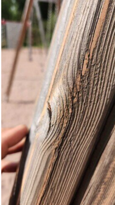
Kuva 33 Kulunut