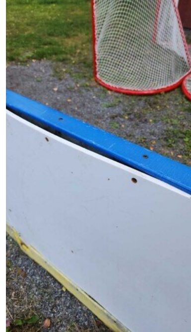
Kuva 43 Laita kuprulla, ruuvit puuttuu