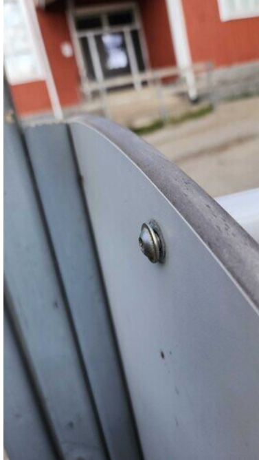
Kuva 6 Ruuvi löysällä