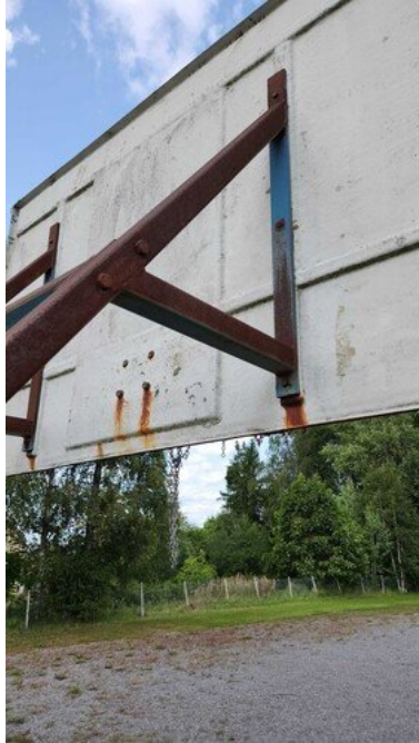
Kuva 51 Teline ruosteessa