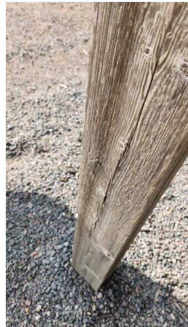
Kuva 17 Naula törröttää