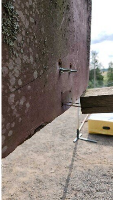
Kuva 18 Ruuvit törröttää