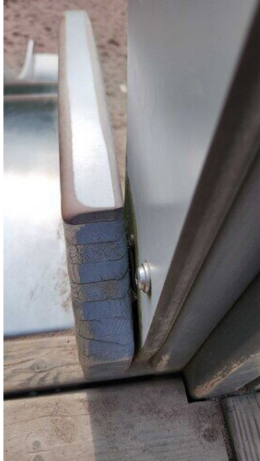
Kuva 9 Hupparinnarun kiinnijuuttumisvaara