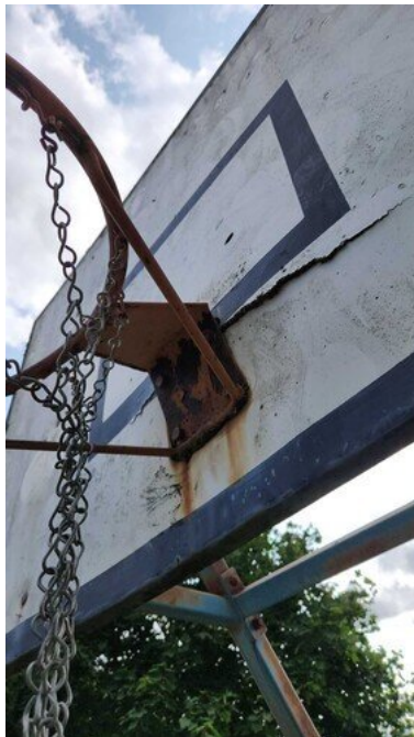
Kuva 49 Korirengas ruostunut ja korilevy rikki