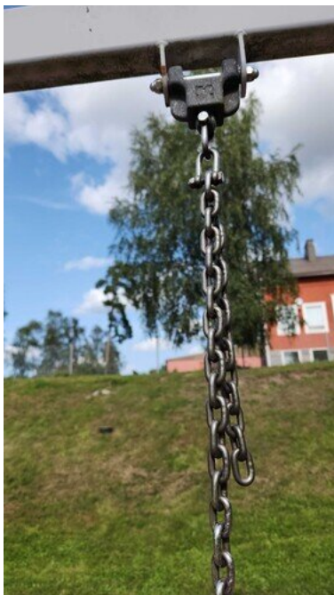
Kuva 34 Kuluneet sakkelit ja ketjut. Ketjussa saa olla ylimääräisiä lenkkejä maksimissaan kolme kappaletta, sakkeleita ei saa olla kuin yksi