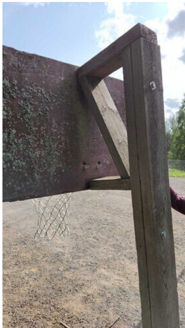
Kuva 16 Todella kulunut