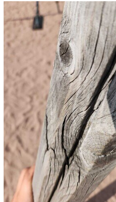
Kuva 28 Tikkuilee