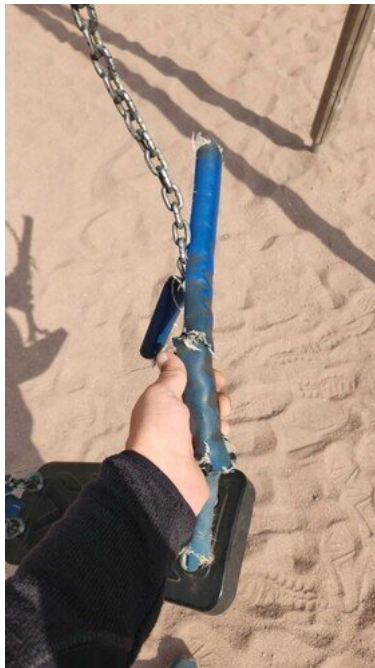
Kuva 27 Ketjunsuojat rikki