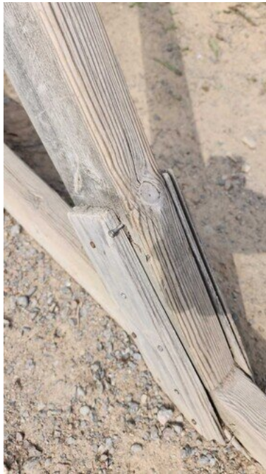
Kuva 14 Ruuvi törröttää